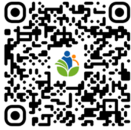
臺北市勞動大學 官網