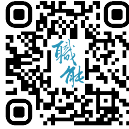
臺北市職能發展學院 官網